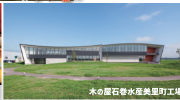
木の屋石巻水産 美里町工場