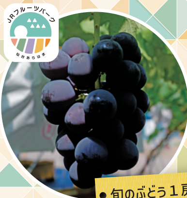
● 旬のぶどう 1 房狩り