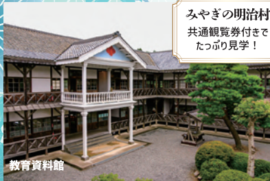
みやぎの明治村 共通観覧券付きで たっぷり見学!