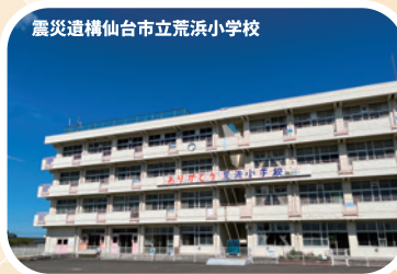
震災遺構仙台市立荒浜小学校