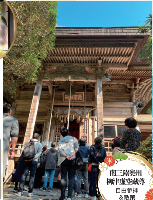
南三陸奥州 柳津虚空蔵尊 自由参拝 & 散策