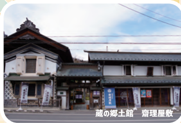
蔵の郷土館 齋理屋敷